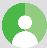
自我管理式的 在线学习

BMJ理解研究人员面临的各种挑战，也深知高等院校在科研工作中常有的疑惑。BMJ可为学生与教师提供文章发表方面的支持和培训、帮助他们在高影响力期刊上发表文章。与文章发表相关的培训包括培养扎实全面的研究技能以及培养高标准的伦理意识。